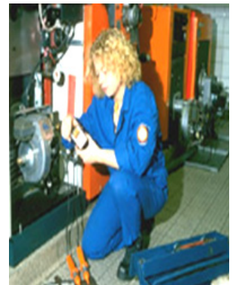
Mess- und Einstellungen und/oder Instandsetzung eines Gas-Gebläsebrenners