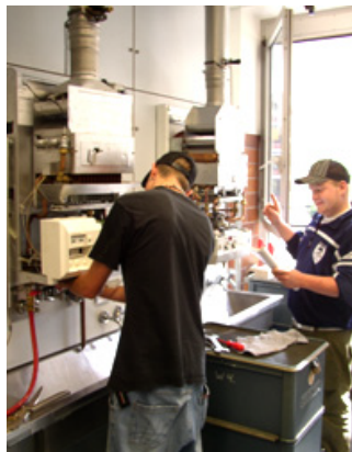
Elektroverdrahtung, Inbetriebnahme, Einstellung Beachtung Umweltschutz