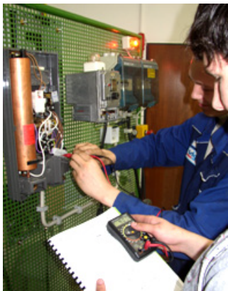
Instandsetzung eines Elektrodurchlauferhizers Inbetriebnahme