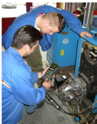
Mess- und Einstellungen und/oder Instandsetzung eines Ölbrenners