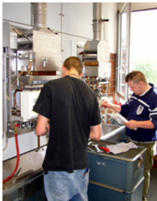
Wartungs- und/oder Instandsetzungsarbeiten in der Gas- Gerätetechnik