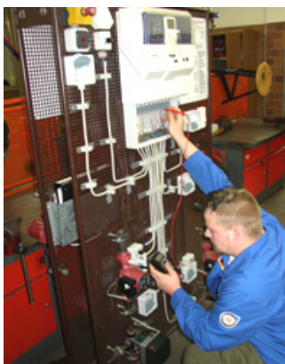
Einstellen der witterungsgeführten Heizungsregelung nach Kundenwünschen