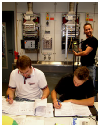
Mess- und Einstellarbeiten nach Leistungsangaben der Gas- Gerätehersteller